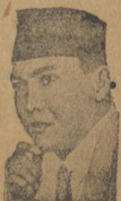
On ma da gambaran ni Ir. Soekarno

Ditanda hamoena moese do manang gambaran ni ise na di toroe on, djala diboto hamoena do manang na dia ala na oembahen toeng pola pamasoehon gambaranna di Pardomoean Batak on?